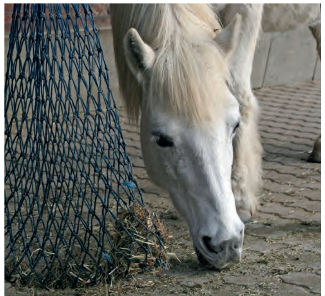
Wird konsequent die Entwicklung der Endoparasiten durch gute Hygienemaßnahmen unterbrochen, kann keine Reinfektion erfolgen.