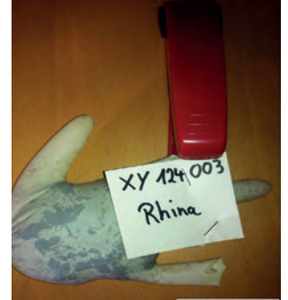
Dann noch sachgerecht verpacken.