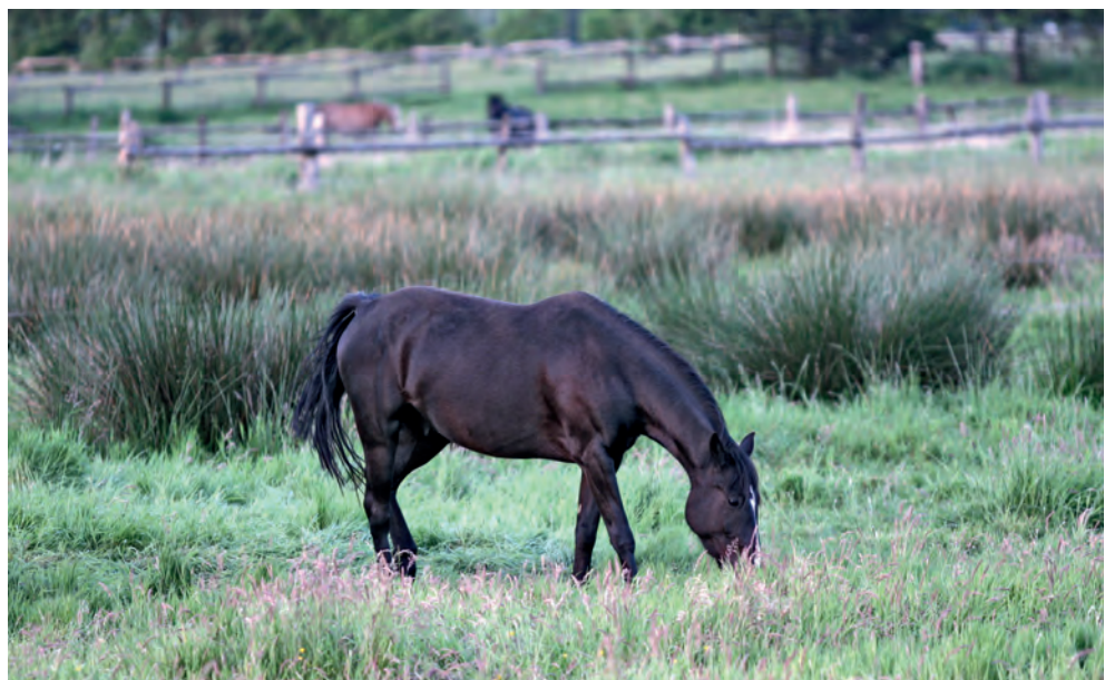
Auf feuchten Weiden finden einige Endoparasiten besonders gute Bedingungen vor, etwa Bandwürmer, die als Zwischenwirt die Moosmilbe brauchen, ebenso wie Leberegel.

Scheidet ein hoher Ausscheider weiterhin mehr als 200 EpG (Strongylideneier) aus, so wird er weiter kontinuierlich entwurmt. Im Hochsommer sollte 14 bis 21 Tage nach der Entwurmung eine weitere Kotprobe untersucht werden. So wird überprüft, ob sich gegen das verwendete Präparat eine Resistenz entwickelt. ▶▶