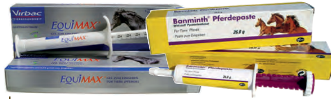
Unterschiedliche Wirkstoffe gegen verschiedene Wurmartensind im Handel. Der Tierarzt sollte den richtigen auswählen.

Es ist also höchste Zeit, das bisherige Vorgehen bei der Wurmbekämpfung zu ändern mit dem Ziel, die Resistenzentwicklung zu verzögern und aufzuhalten. Eine Methode dazu ist – ver-