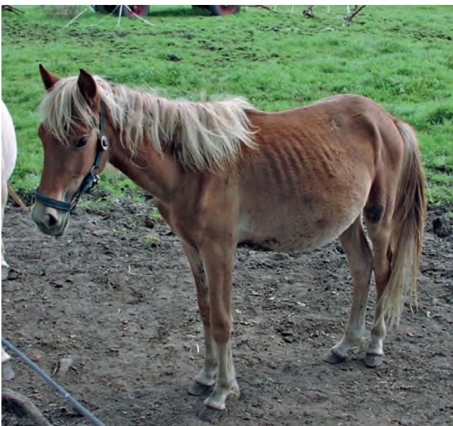
Ein Fall für den Tierschutz: Fohlen können aufgrund starker Verwurmung sogar verenden.

Hier setzen nun die Überlegungen für eine neue, nachhaltige, gezielte und langfristige Parasitenüberwachung bei Pferden an. Diese hat zum Ziel, massive Wurminfektionen zu verhindern und dabei durch einen geringen Wurmbefall das pferdeigene Immunsystem zu stimulieren. Gleichzeitig wird durch einen gezielten, im Ausmaß reduzierten und auf seine Wirksamkeit hin überprüften Arzneimittel Einsatz die Resistenzentwicklung verzögert. Mit dieser Prämisse wird in Dänemark schon seit über zehn Jahren die selektive Entwurmung angewendet. ►►