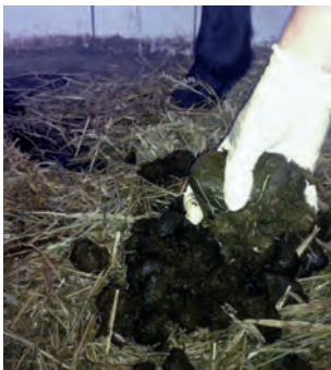
Kotprobennahme aus einem frischen Äppelhaufen.