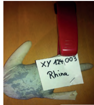
Dann noch sachgerecht verpacken.